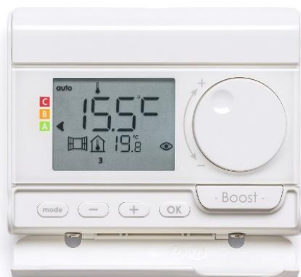
Zusätzlich gegen Aufpreis erhältlich: die integrative Funksteuerung in Weiß.