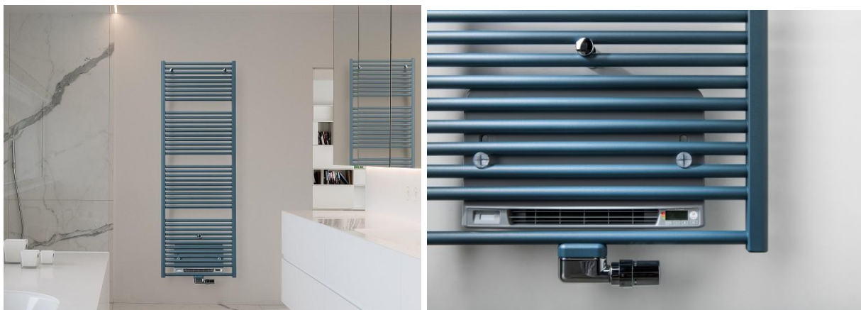
Ton in Ton: Design-Heizkörper Iris (Farbe: Grey Blue) mit Blower (Farbe Gebläse: Grau).

Nachhaltige Herstellung, niedriger Energieverbrauch sowie dauerhaft geringe Betriebskosten sind das Markenzeichen der Design-Heizkörper des belgischen Herstellers Vasco. Das sind aber nicht die einzigen Kriterien, mit denen sie Haus- und Wohnungsbesitzer überzeugen, sie heizen auch besonders klimafreundlich – auf Wunsch zeitgemäß über die Steckdose. Dank neuer, umweltfreundlicher Möglichkeiten der Stromerzeugung wie Solar- und Windenergie ist dies ein willkommener Kostenvorteil für die Haushaltskasse.