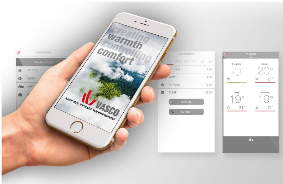
Die bewährte Vasco Regelsystem-App Climate Control sorgt für komfortable Heizungssteuerung.

Die Temperaturregelung ist in vier Standardszenarien möglich: Aufstehen, Abwesenheit, Zuhause sein und Schlafen. Tagespläne sind pro Raum und Nutzerschema individuell programmierbar. Die Climate Control-App von Vasco steht ebenfalls als kostenloser Download für iOS und Android zur Verfügung.