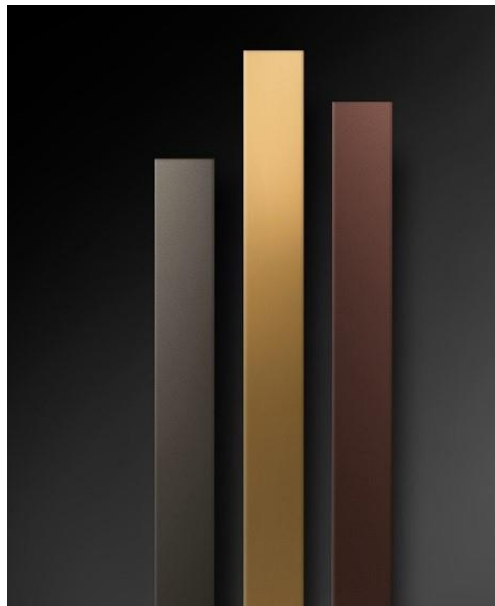
Beams Mono ist nur 150 Millimeter breit und in Pearl Beige, Gold oder Bronze ein echter Hingucker.

Nachhaltige Fertigungsprozesse, technisches Finesse und eine straffe Formgebung kennzeichnen sämtliche Produkte, die es in der klassischen Variante, ausgewählte Modelle auch in einer elektrischen Ausführung gibt. Vom mehrfach prämierten Modell Beams Mono bis zum vielfach preisgekrönten Allrounder, dem Design-Heizkörper Oni, harmonieren alle Produkte mit eleganten und zeitgemäßen Inneneinrichtungen, Materialien und Farben.